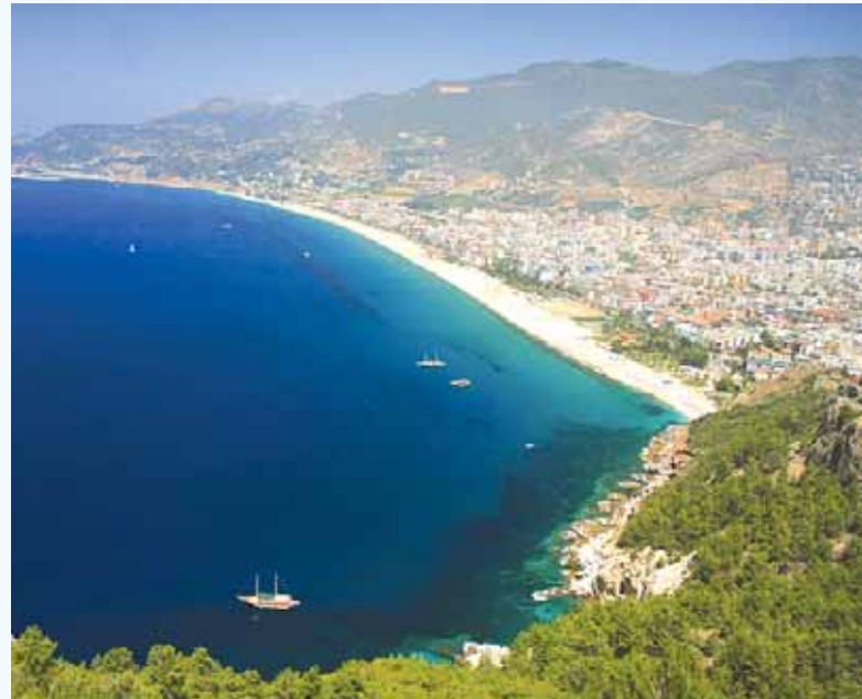
Alanya Klaopatra Plajı

http://www.tuik.gov.tr/jsp/duyuru/upload/adnks_Harita_TR/HaritaTR.html