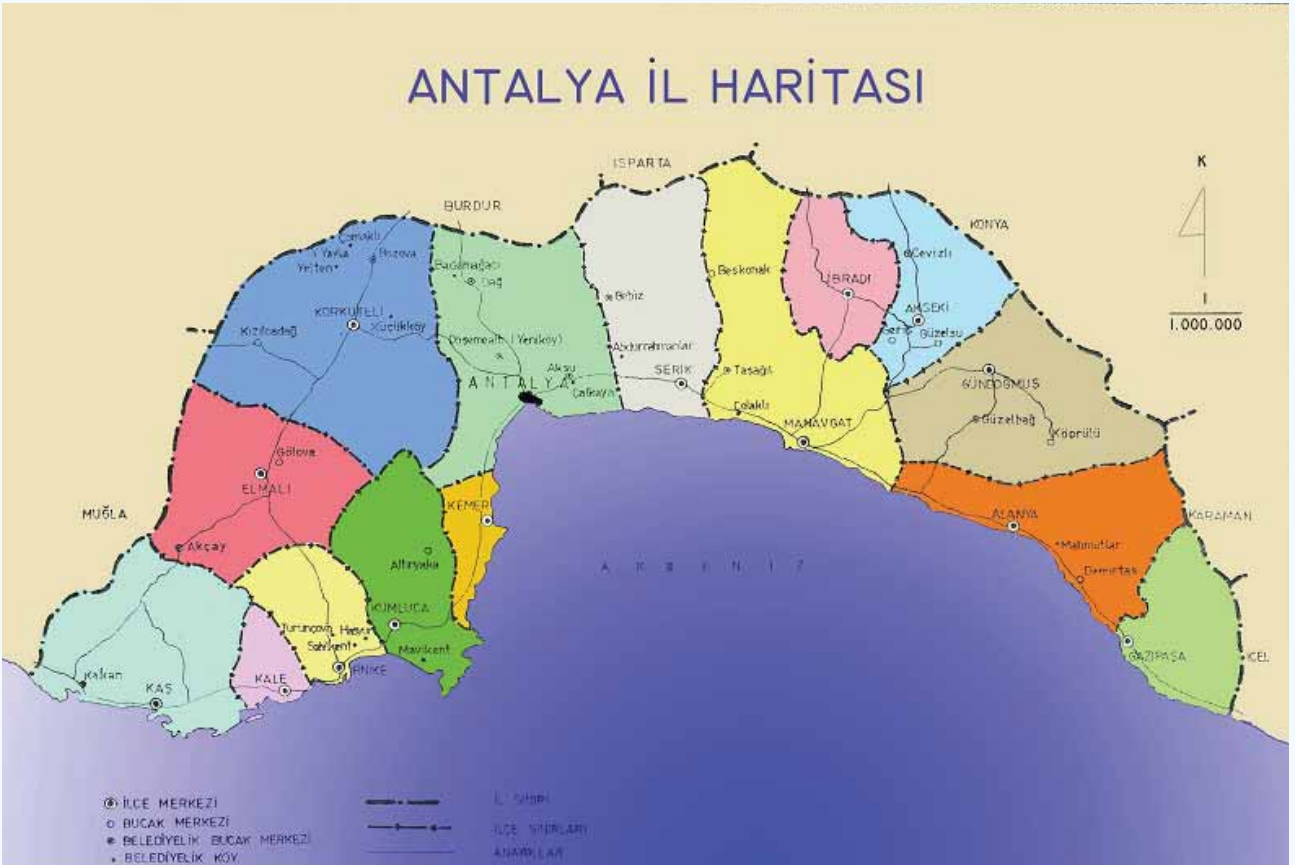
Antalya'nın 5747 Sayılı Kanundan Önceki 14 İlçe İdari Haritası