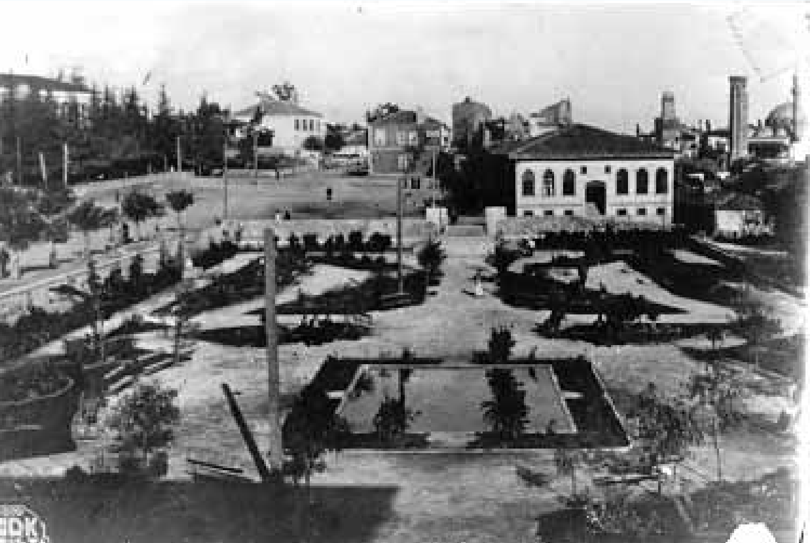
Cumhuriyet Meydanı ve Telgrafhane-1932