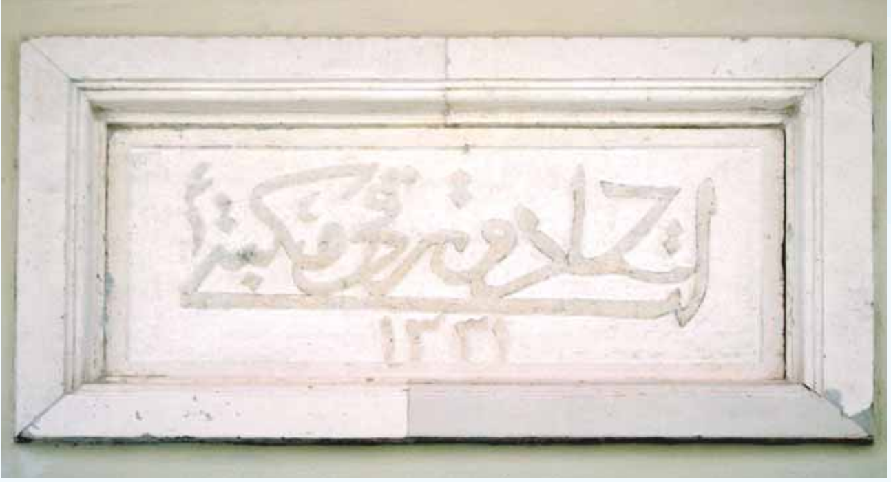
Foto-1:Yeni Valilik Binasının Doğu Cephesindeki Levha-(20/07/2007) (İttihad ve Terakki Mektebi-1331)