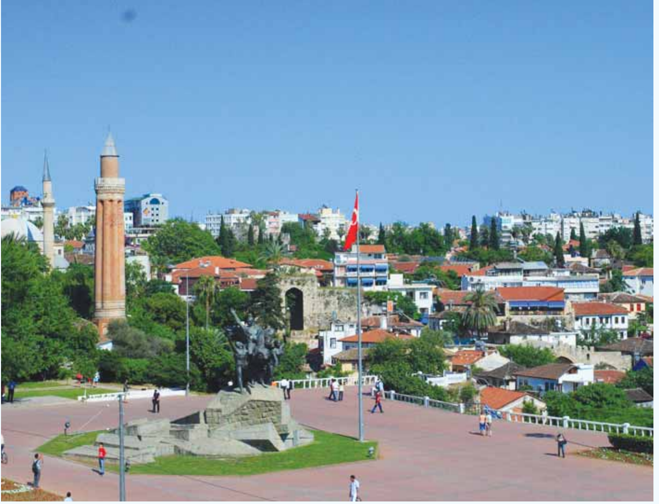
Antalya Cumhuriyet Meydanı-2007-(Foto:M.DÖNMEZER)