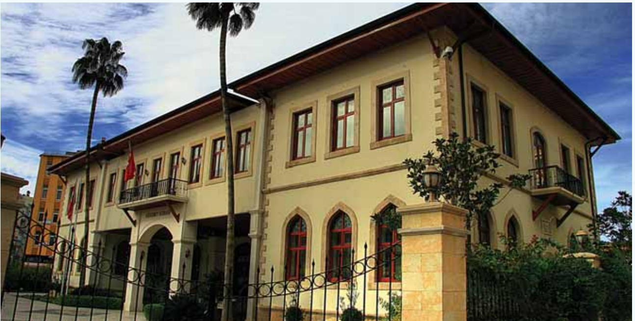
Antalya Valilik Binası-2010

Şu andaki yeni Valilik binasının, Cumhuriyetin ilk yıllarında "İttihad Ve Terakki Mektebi" olarak hizmet verdiği görülmekte olup konu ile ilgili bilgi aşağıda belirtilmektedir.