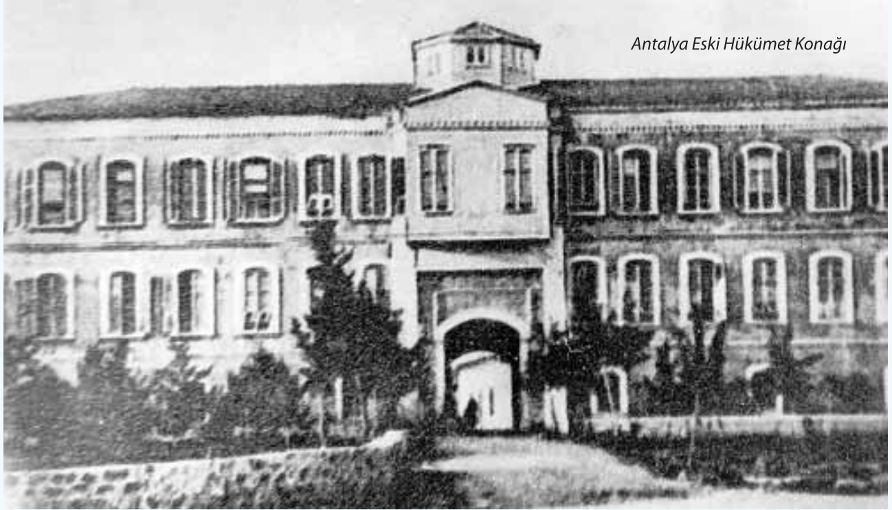
Antalya Eski Hükümet Konağı

İlimizde, Hükümet Konağı adı ile bilinen Valilik binasının, Cumhuriyetin ilk yıllarında, en son yıkılan yandaki resimde görülen beş katlı Valilik binasının olduğu yerde bulunan, aşağıdaki siyah beyaz fotoğrafta görülen ve yıkılmış olan binada hizmet verdiği, kayıtlardan ve kaynak kişilerin ifadelerinden anlaşılmaktadır.