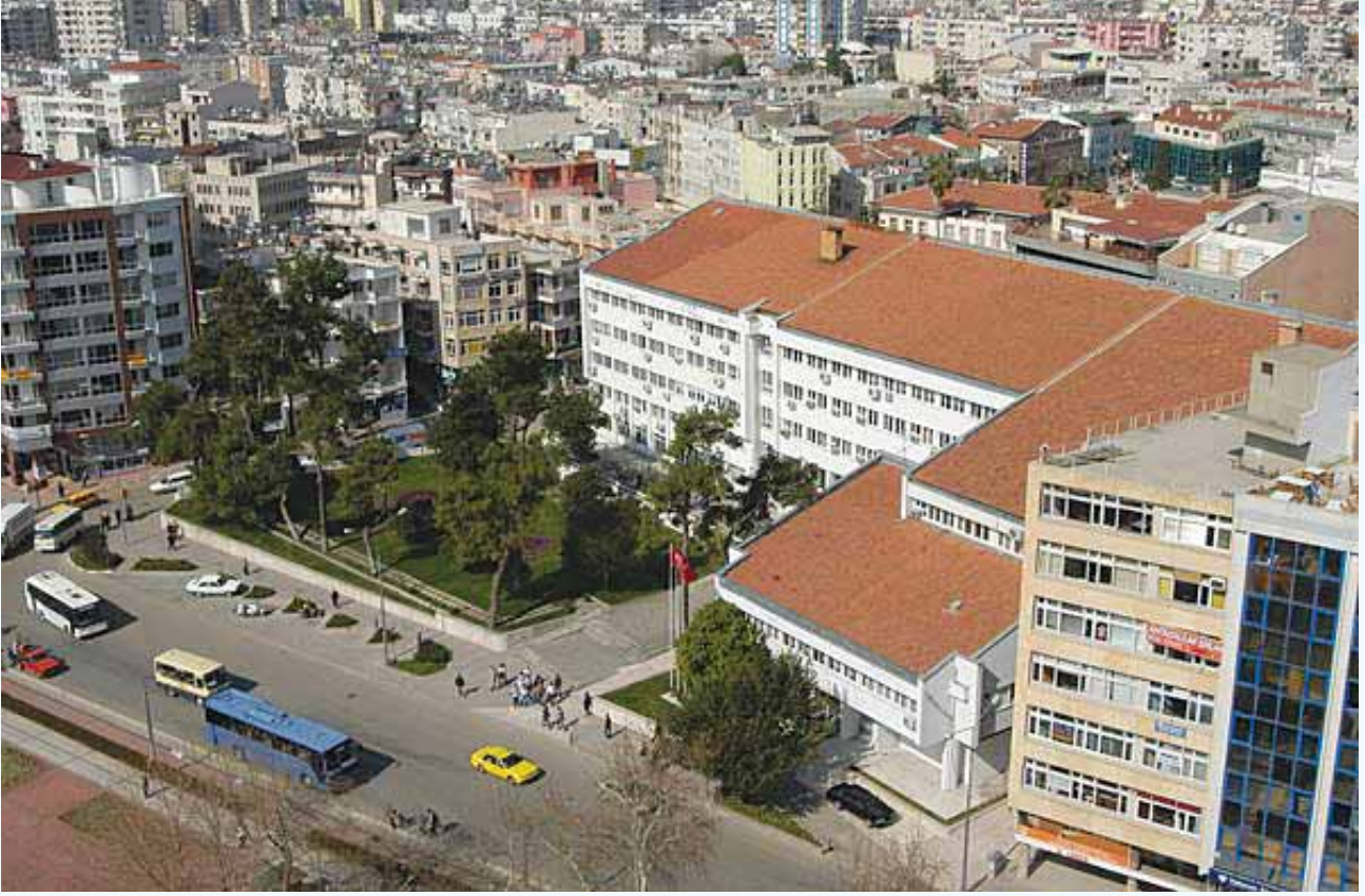
Antalya Eski Valilik Binası (Yıkılan)-(Foto:www.antalya.bel.tr)

Halen daha önce Gazi Mustafa Kemal İlköğretim Okulu olarak hizmet veren aşağıdaki resimde görülen tarihi binanın mevcut Valimiz Alâaddin YÜKSEL'in, titiz takip ve destekleri ile aslına uygun olarak estetik ve otantik bir şekilde onarılması ile bu binada ve ilimizde; "Bürokratik Kültürden Vatandaş Odaklı Kamu Hizmeti Kültürüne Geçiş, Mutlak Hedefimizdir" parolası ile hizmetini sürdürmektedir.