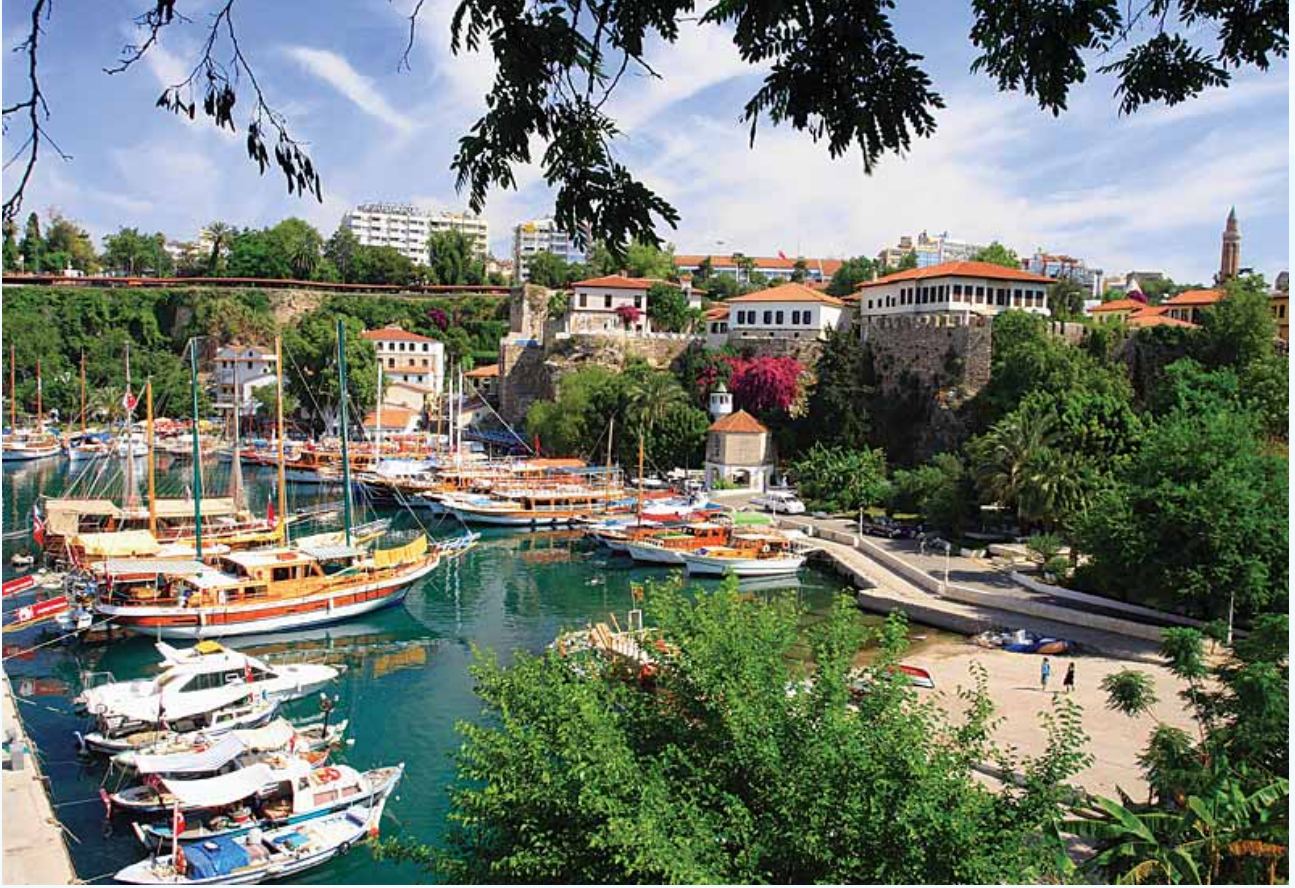
Antalya Yat Limanı ve Kaleiçi - 2007