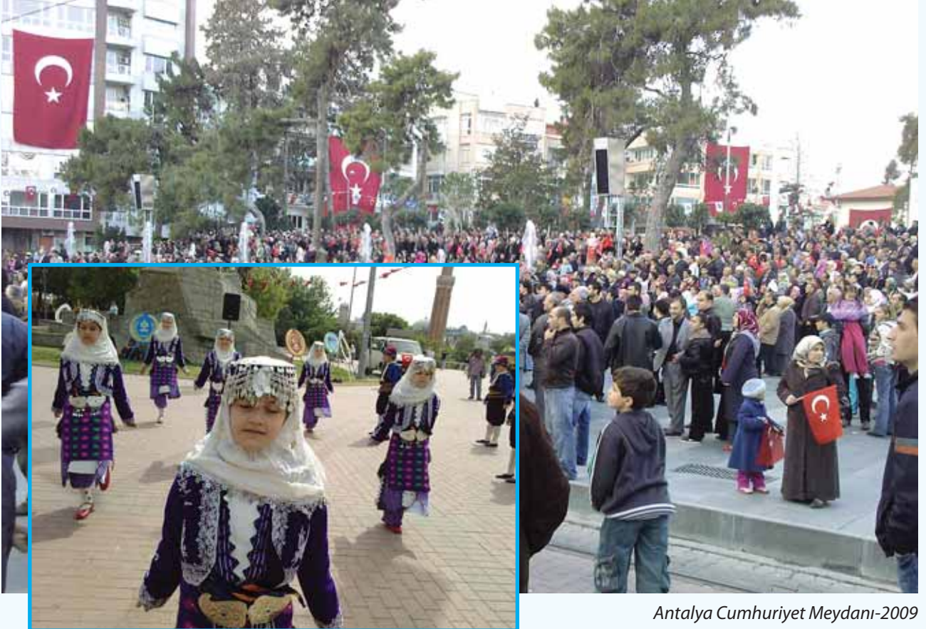
Antalya Cumhuriyet Meydanı-2009